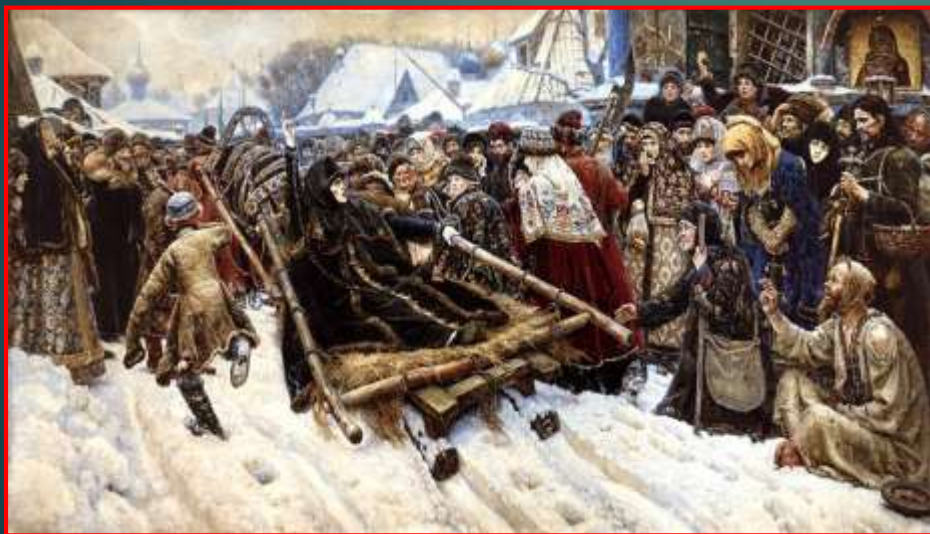
В.Суриков «Боярыня Морозова»

жанр изобразительного искусства, посвященный историческим событиям и деятелям, а также социально значимым явлениям в истории общества.