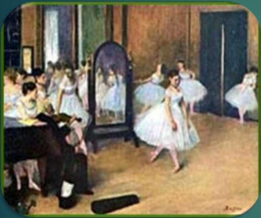
Эдгар Дега «Танцевальный класс»