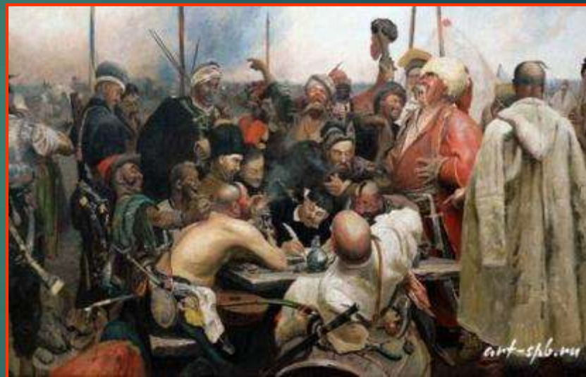
И.Репин «Запорожцы пишут письмо турецкому султану»