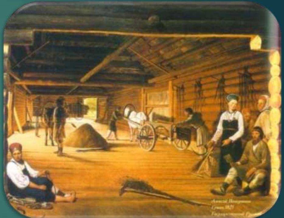
А. Венецианов. Гумно.